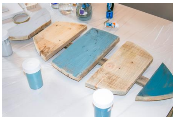
Objet déco par Lilou In The Wood

Exemple d'utilisation de nos peintures par des designers :