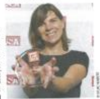
LSA n° 2365 | 24 octobre 2015

La Fromagerie Gillot soutient la filière AOP de Normandie fruit de nombreux échanges avec ses producteurs AOP, la fromagerie Gillot met en place une politique de rémunération spécifique garantissant, pour quatre ans, un prix de lait de 340€ les 1000l pour 50% des volumes collectés, « les 50% restants étant payés au prix de la Convention », précise la Fromagerie Gillot suite à l'article paru dans le n° 2365 de LSA. La prime AOP a, elle, été valorisée de 46, passant de 30€ à 36€ les 1000l en 2015 et de 7€ de plus en 2017.